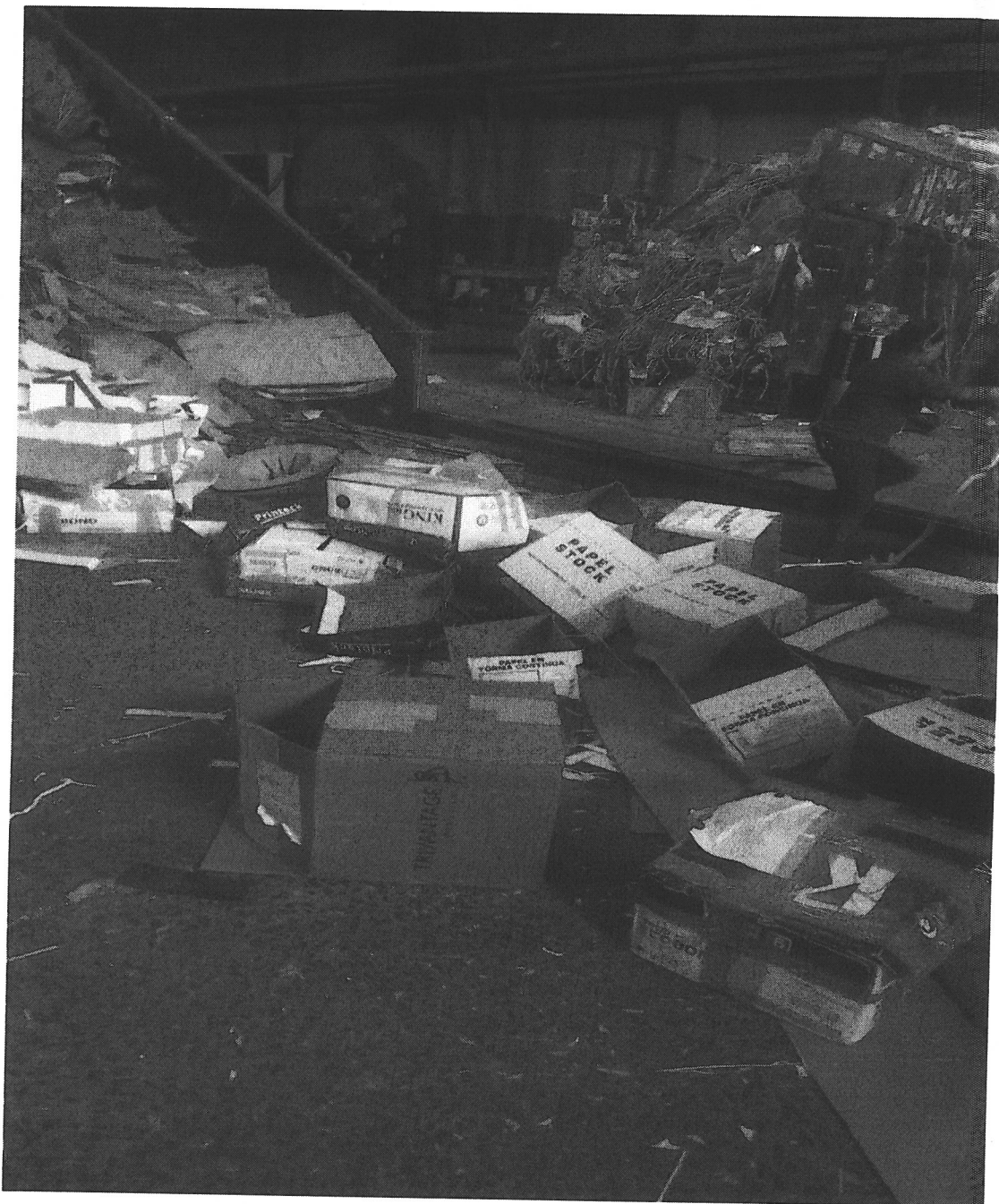
INICIO DEL PROCESO DE DESTRUCCION POR METODO DE RECICLADO.